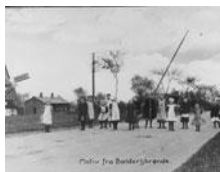
Bom over Roskildevej ved Baldersbrønde

Forslag: Er du på cykel, kan du efter skattejagten køre ud og se de to gravhøje, hvor Baldur og hans hest, ifølge sagnet, ligger begravet. Fortsæt ad cykelstien. Kort efter du er kørt under motorvejen, ligger højene til venstre.